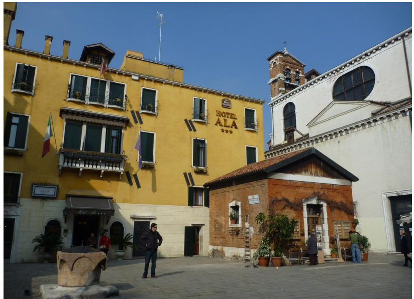
ヴェネツィアのホテル（サンマルコ広場に近くて便利） お部屋の造りはバラつきがあります。予めご了承ください。