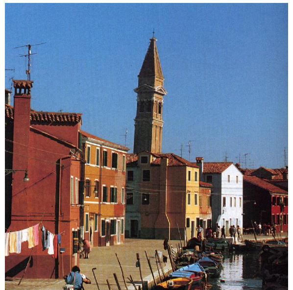
ブラーノ島（ヴェネツィア）